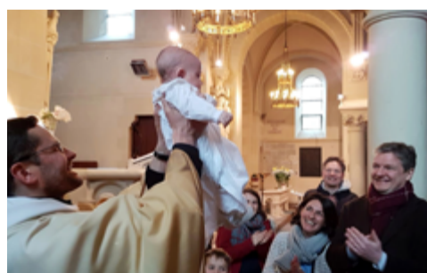
Le baptême en questions