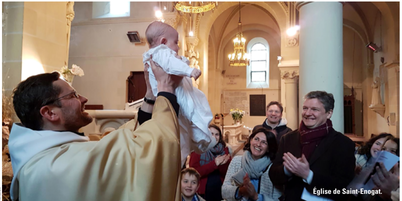
Église de Saint-Enogat.