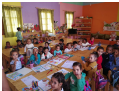
Les enfants de la province d'Errachida.