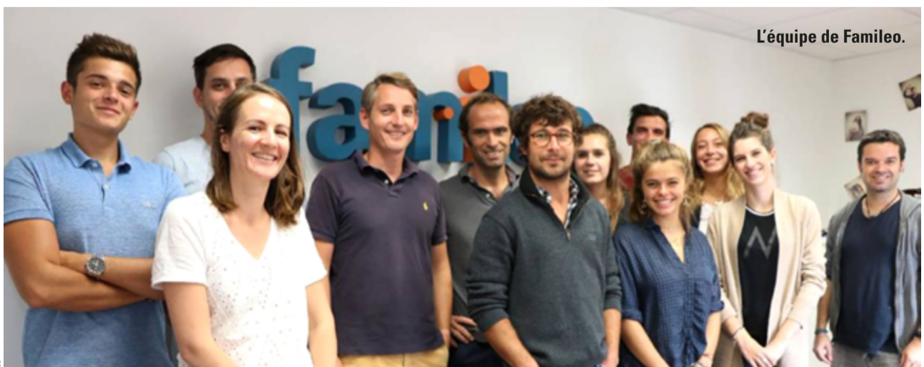
L'équipe de Famileo.

www.famileo.com contact@famileo.com - 02 99 19 29 56