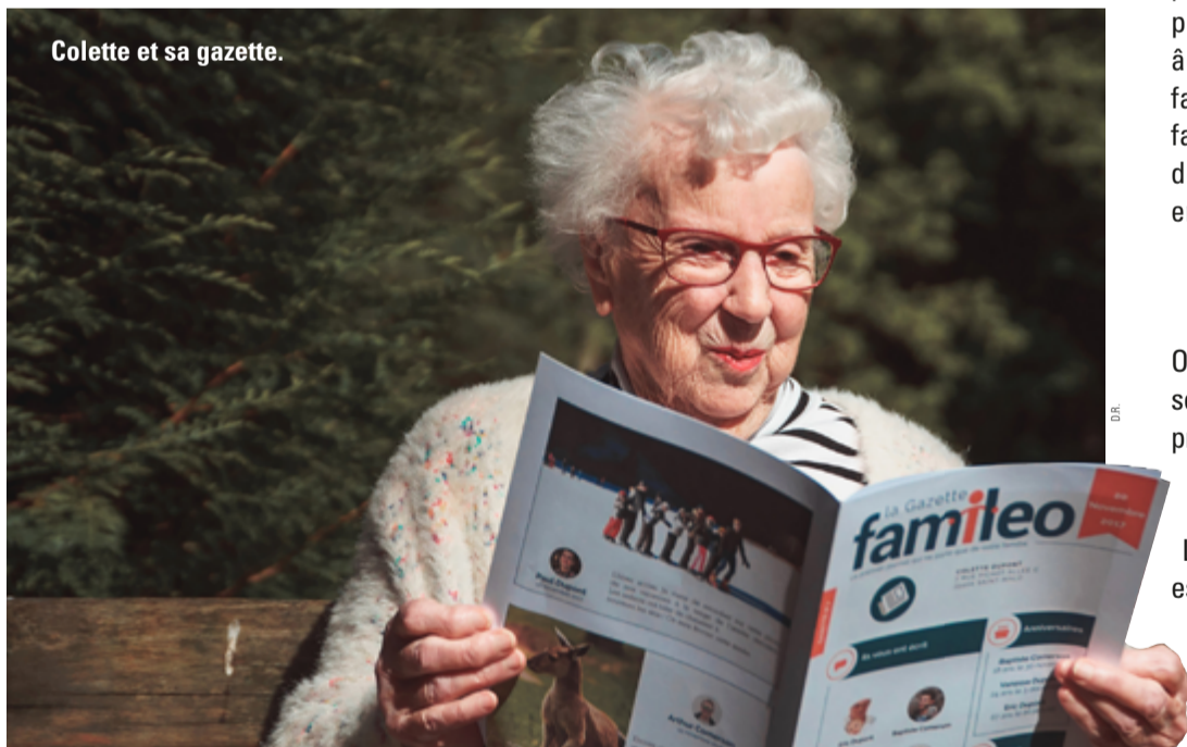
Colette et sa gazette.

"Notre monde a besoin d'une révolution de l'amour ! Que cette révolution commence chez vous et dans vos familles"