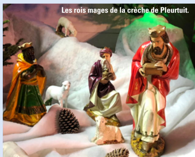
Les rois mages de la crèche de Pleurtuit.

12 septembre 2018 : plus de 60 élèves et adultes ont découvert la chapelle et le parc de la Maison mère des Petites Sœurs des Pauvres, "La Tour Saint-Joseph" à Saint-Pern.