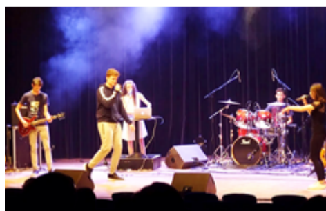
La pop chrétienne pour toucher les cœurs