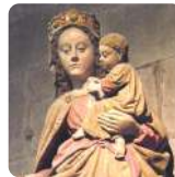
Vierge de la Grande Porte Saint Malo