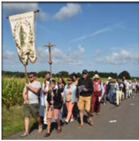
Pardon de Notre-Dame de l'Épine à Saint-Briac

25 août: À la fin du XIX e siècle, la chapelle de l'Épine faisait l'objet d'une grande vénération, les marins y faisant de fréquents pèlerinages. Perpétuant la tradition, paroissiens et estivants étaient encore nombreux en cette fin août, à marcher derrière la Croix et la bannière jusqu'à la chapelle Notre-Dame de l'Épine, où chacun a pu assister à la messe en plein air.