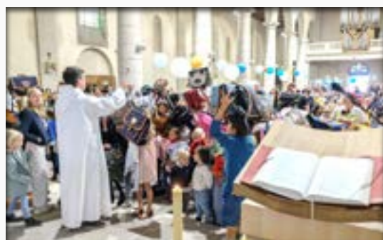
Le DEP et la bénédiction des cartables