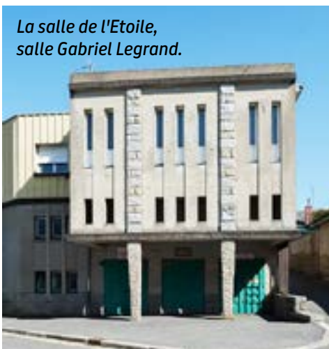
La salle de l'Étoile, salle Gabriel Legrand.