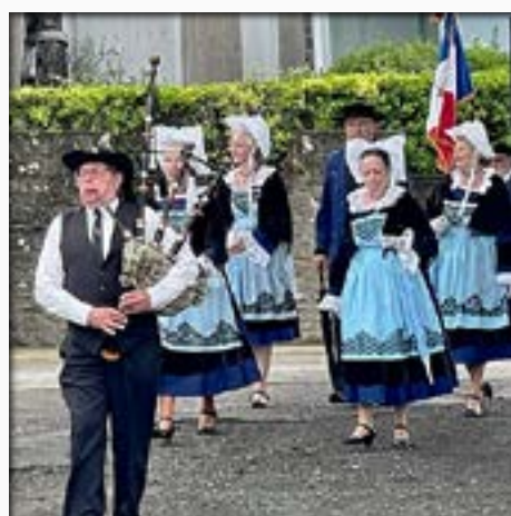
Cérémonie pour les marins disparus en mer

25 août: À la fin du XIX e siècle, la chapelle de l'Épine faisait l'objet d'une grande vénération, les marins y faisant de fréquents pèlerinages. Perpétuant la tradition, paroissiens et estivants étaient encore nombreux en cette fin août, à marcher derrière la Croix et la bannière jusqu'à la chapelle Notre-Dame de l'Épine, où chacun a pu assister à la messe en plein air.