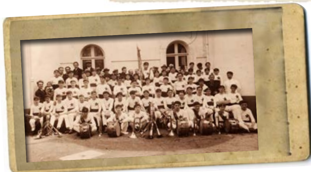
La fanfare de l'Étoile (avant 1939).