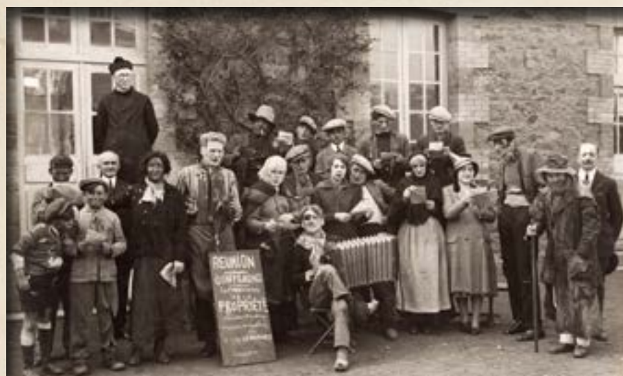
La section théâtre avant la 2 e Guerre mondiale.