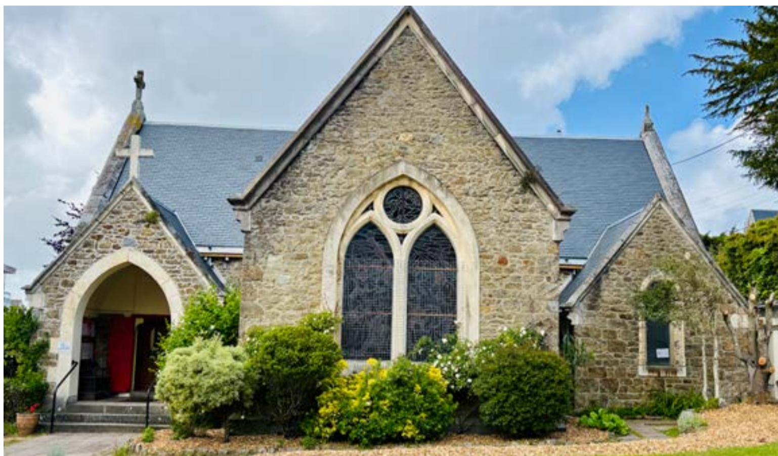
L'église St. Bartholomew, rue Faber à Dinard.

Le charmant jardin parcouru et le porche franchi, on pénètre dans le large espace de la nef principale. La superbe voûte en bois qui retombe sur de minces colonnettes apporte une note chaleureuse et accueillante. Elle se marie avec le bois des longs bancs égayés par les célèbres coussins de tapisserie : motifs religieux ou poétiques, paysages, drapeaux se mêlent en une symphonie colorée. Une grande verrière éclaire le mur du chevet, derrière l'autel. Plus étroite, la deuxième nef, au nord, mène à l'orgue de 1894, l'un des joyaux de l'église. La communauté a fait appel à un facteur d'orgue londonien, Alfred Oldknow, déjà bien connu à Dinan où vivait une forte population anglaise : quelques années plus tôt, il y avait réalisé le grand orgue de l'église Saint-Malo et celui de l'église anglicane. Parfaitement entretenu et restauré, l'orgue de St. Bartholomew expose, à la façon anglaise, ses tuyaux peints de bleu et de beige.