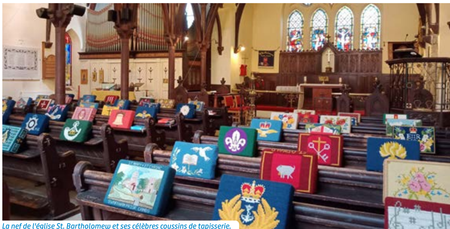
La nef de l'église St. Bartholomew et ses célèbres coussins de tapisserie.

Office à 11h le dimanche Horaires d'ouverture 10h-17h, dimanche 12h-18h