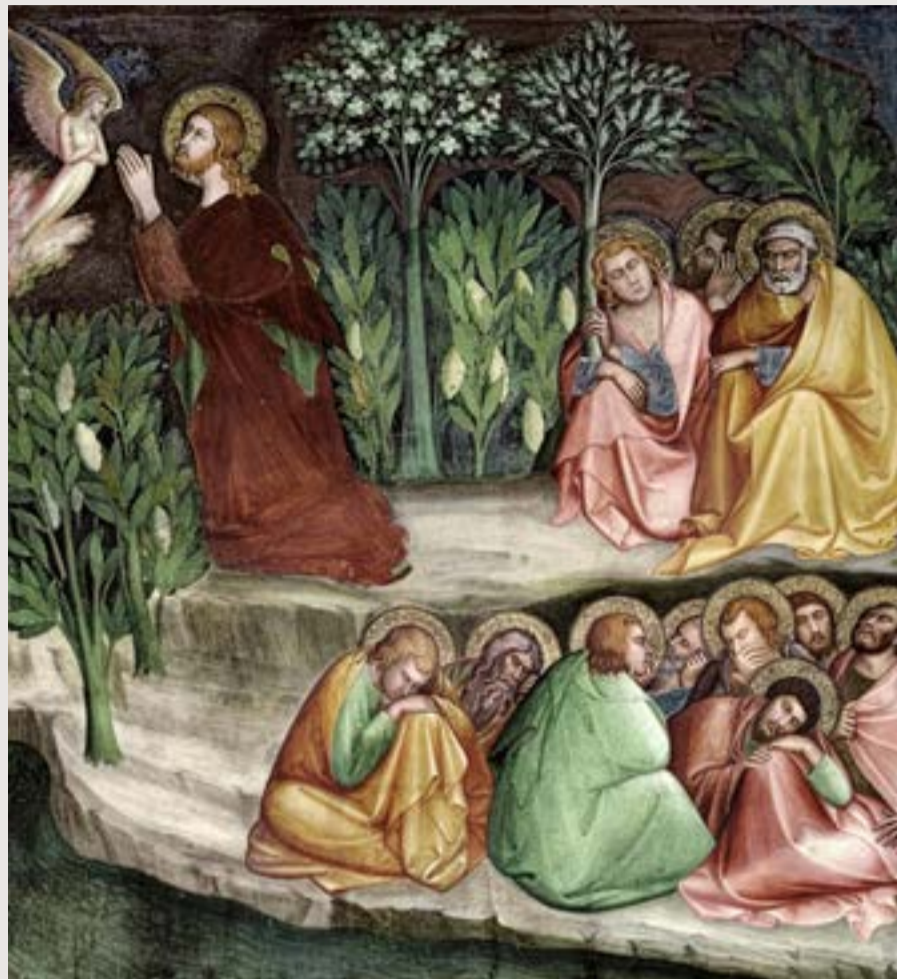
Jésus au jardin de Gethsémani. Fresque de la Renaissance visible dans l'église de Santa Maria Assunta à San Gimignano en Italie.

Peu avant son arrestation, le soir du Jeudi saint, Jésus se rend au jardin de Gethsémani pour prier. Ses disciples, à qui il a demandé de veiller, se sont endormis. Il s'adresse à son Père dans une profonde angoisse, conscient de l'épreuve qui l'attend. Dans sa prière, il exprime à la fois sa peur et sa faiblesse dans son humanité, et sa confiance totale en Dieu: « Mon Père, à toi tout est possible... cependant, non pas ce que je veux, mais ce que tu veux. » Par cet abandon, il montre un courage intérieur remarquable: celui de s'en remettre pleinement à Dieu pour affronter la souffrance et rester fidèle à sa mission.