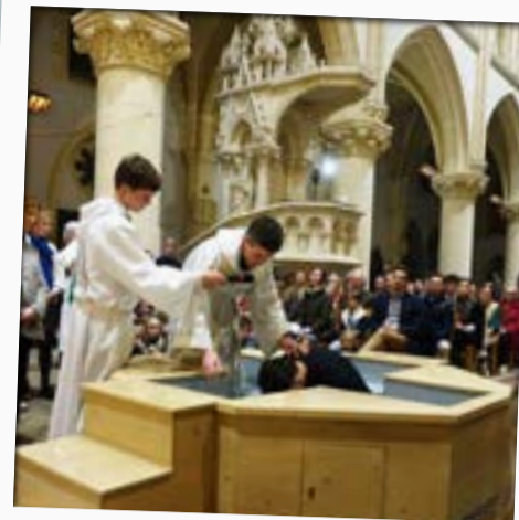
Baptêmes d'adultes à la Vigile pascale