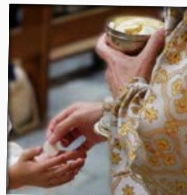
Première communion à Pleurtuit et à Dinard

23 au 24 mai 2026 à Saint-Malo: 750 sixièmes, dont 33 de la paroisse, se sont retrouvés pour un week-end sous la tente à Kériadenn! Jeux, témoignages, prière, amis, veillée... des souvenirs pour la vie. Les jeunes sont revenus heureux de cette belle proposition diocésaine! L'année prochaine, on y retourne les 22 et 23 mai. Contact: pastojeunes@paroissedinardpleurtuit.fr